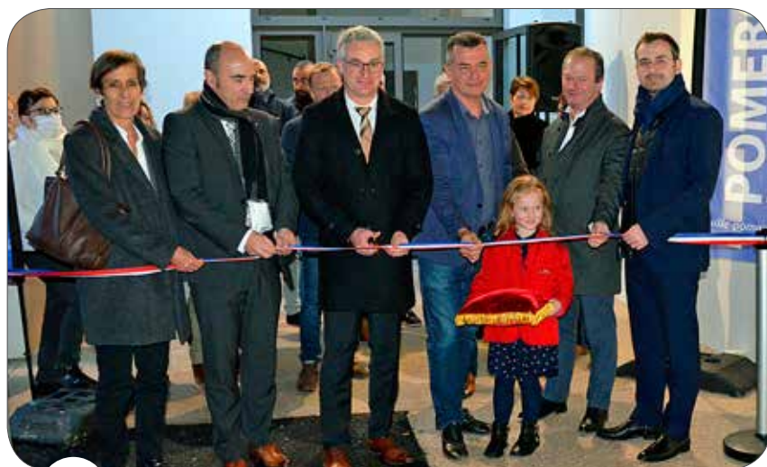
6 INAUGURATION DU PÔLE MÉDICAL