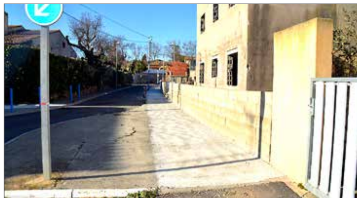
Le trottoir à la fin du chemin de la boule ronde est terminé.

Comme je vous l'avais écrit dans le numéro précédent, la cabine téléphonique installée à l'ancienne gare qui sert de bibliothèque libre comme à la place est opérationnelle vous pouvez y apporter des livres et en emprunter. (Bonne lecture).