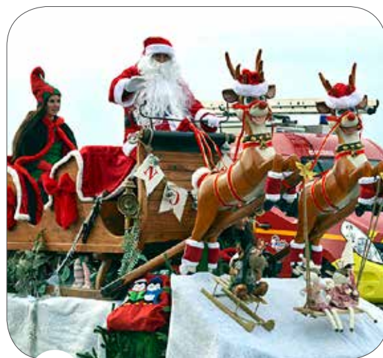
25 LE MARCHÉ DE NOËL EN IMAGES