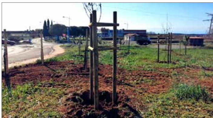
Au rond point de super U à côté des oliviers déjà plantés, des arbres offerts par le Département ont été transplantés, cet endroit sera aménagé avec du mobilier urbain. Les personnes se promenant ou allant à super U pourront faire une halte.

À l'heure où je vous écris, un sondage est en cours pour savoir si les PAV (point d'apport volontaire) restent à l'angle de la route Mèze ou si on les réinstalle sur la place.